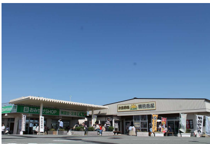
朝熊山頂売店・朝熊茶屋