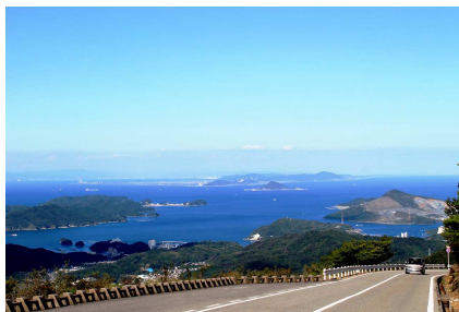
伊勢志摩スカイライン

伊勢と鳥羽を結ぶ、全長 16.3km の“天空のドライブウェイ”。山頂展望台では、伊勢志摩や伊勢湾の大パノラマが展開し、天候に恵まれれば富士山まで眺望できます。さらに眺望と四季の花木で彩られた「さんぼ道」や、ゆったりした気分で眺望が楽しめる「展望足湯」などがあります。また、山頂広場には、昔ながらの可愛い丸型の「天空のポスト」が設置してあり、「恋人の聖地」に選定されています。